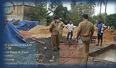
Cek Lapangan Permohonan IMB